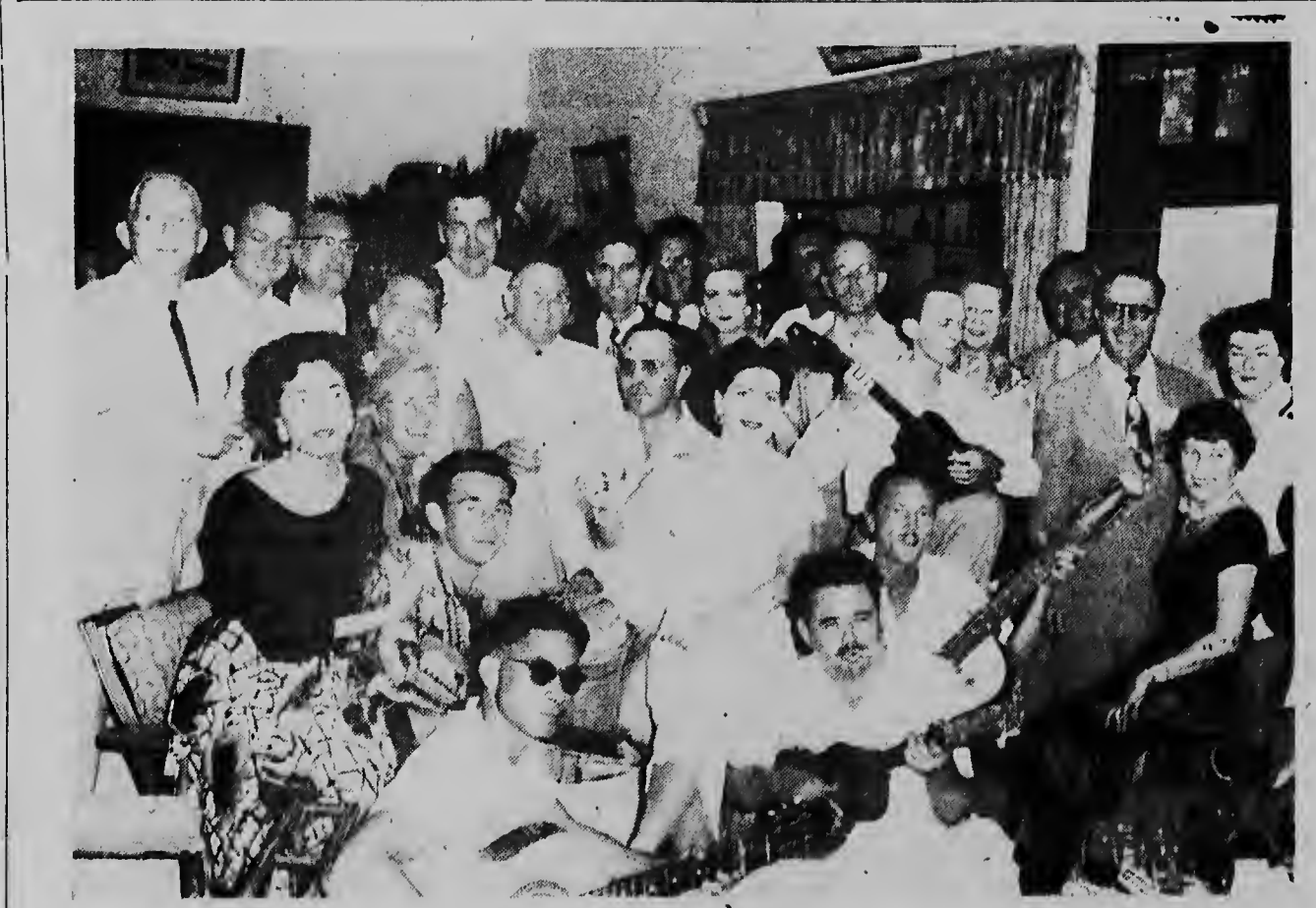
Dat het Woensdagavond gezellig toeging op de Palm Beach Club met de toeristen van de „Tradewind" en muzikmakers van ons eiland bewijst wel deze foto.

LIKUR voor Afrika. WAAR NU dit geniëschappelijke vat geen voldoende afvoer naar de industrie vindt, verschijnt tenslotte de likeurtabrikant als redder uit de nood. Om haar als een staatsgeheim behandeld reusachtige tekort te verlichten, levert de alcohollegie te-